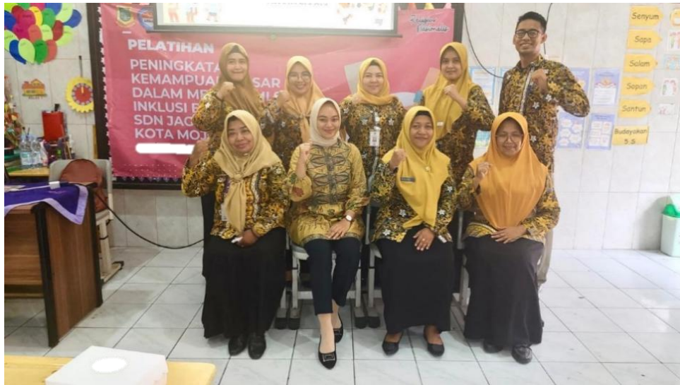
Gambar 8 Foto Pemateri bersama Peserta Sosialisasi yang merupakan Pendidik SDN Jagalan

Dari hasil data evaluasi pada sosialisasi pengabdian ini telah diperoleh data sebanyak 9 peserta sosialisasi klasifikasi, karakteristik, dan identifikasi dini peserta didik penyandang disabilitas (PDPD) telah mendapatkan peningkatan pemahaman dan keterampilan yang signifikan. Hal ini dibuktikan dari hasil pre-test dan post-test pada hari pertama, dan kebenaran hasil identifikasi dugaan yang dilaksanakan pada hari ke dua.