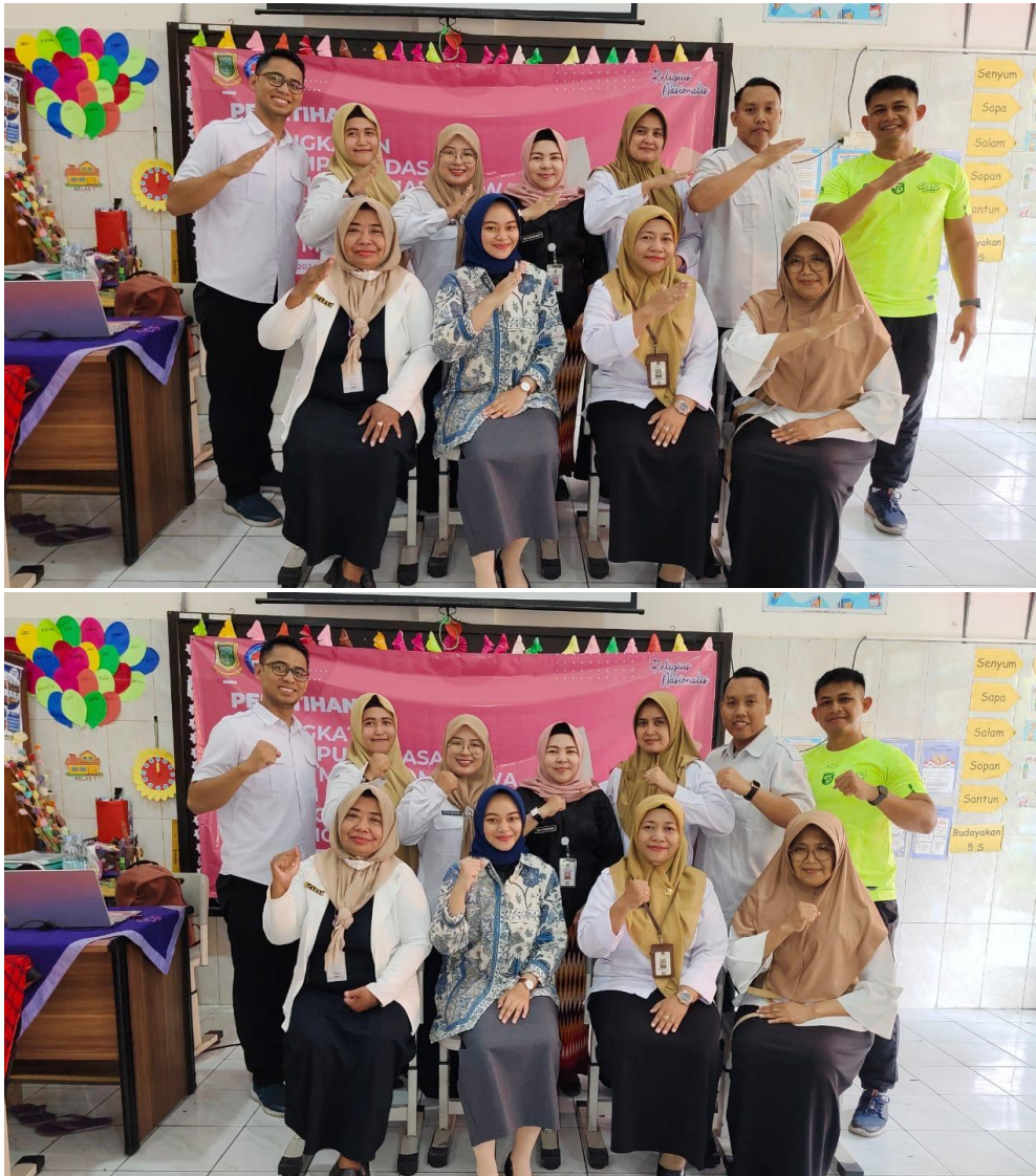
Gambar 4 Foto Pemateri bersama Peserta Sosialisasi yang Merupakan Pendidik SDN Jagalan

kepada orang tua wali tentang pencapaian, hambatan, serta dukungan yang dibutuhkan oleh PDPD di sekolah pada saat pengambilan hasil evaluasi (rapot) peserta didik. Kegiatan pada hari pertama diakhiri dengan berfoto bersama seperti ditampilkan pada Gambar 4.