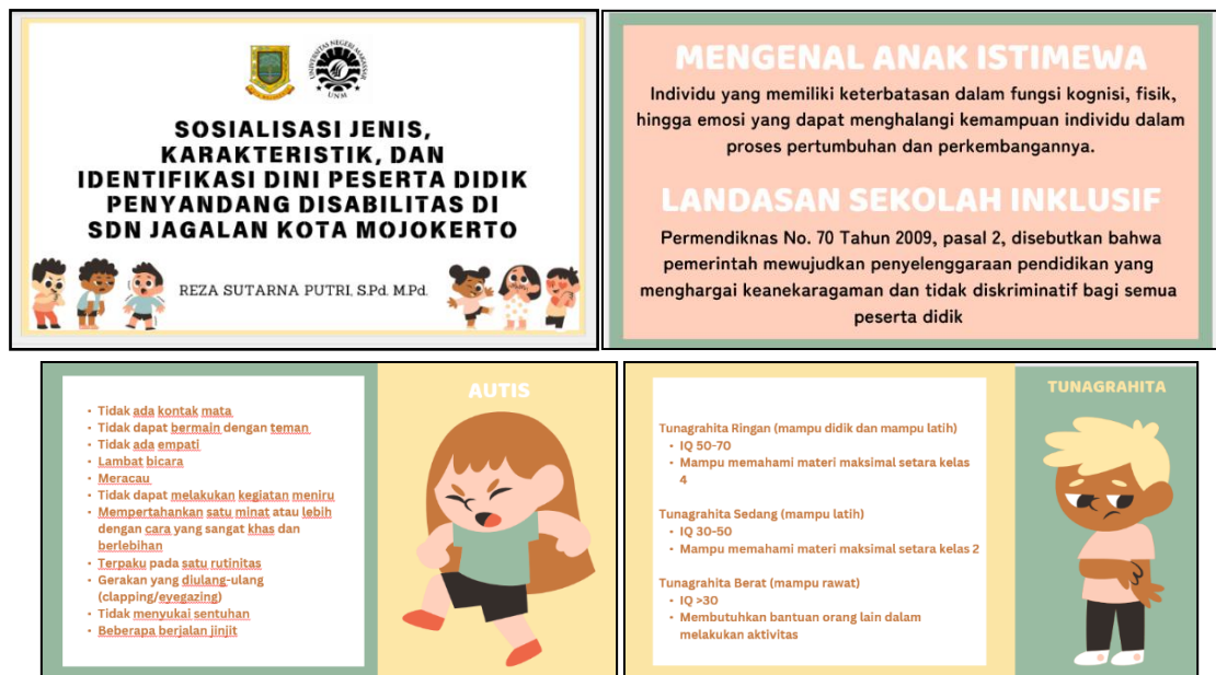
Gambar 3 Materi Sosialisasi klasifikasi dan Karakteristik PDPD

Selanjutnya diadakan sesi tanya dan sharing season jawab pada akhir pemberian materi pertama. Tiga orang pendidik telah memberikan pertanyaan terkait PDPD dan diduga PDPD yang ada di sekolah, pertanyaan tersebut meliputi perbedaan karakteristik PDPD autisme dan ADHD, cara pembiasaan anak autisme untuk masuk kelas untuk melakukan pembelajaran bersama dengan teman regular, dan jenjang pendidikan selanjutnya untuk anak dengan hambatan intelektual sedang. Dua orang pendidik menceritakan tentang kondisi beberapa PDPD yang ada di sekolah seperti, cara para pendidik untuk berkomunikasi dengan peserta didik dengan hambatan pendengaran (tunarungu), serta cara pendidik menyampaikan