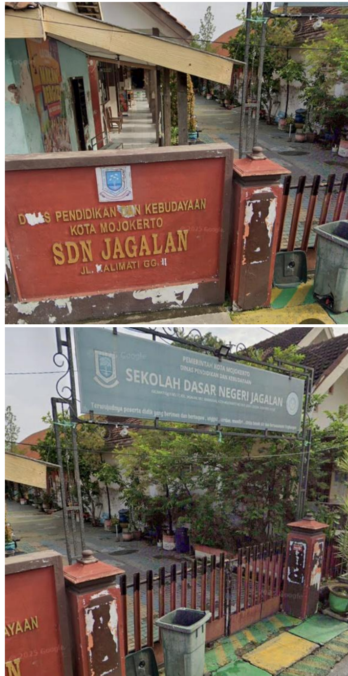
Gambar 1 Sekolah Dasar Negeri Jagalan Kota Mojokerto Provinsi Jawa Timur

Kegiatan pengabdian kepada masyarakat ini telah dilaksanakan selama 2 hari yaitu pada Hari Senin dan Selasa, Tanggal 2 sampai dengan 3 Maret 2026 di SDN Jagalan Kota Mojokerto, Jawa Timur.