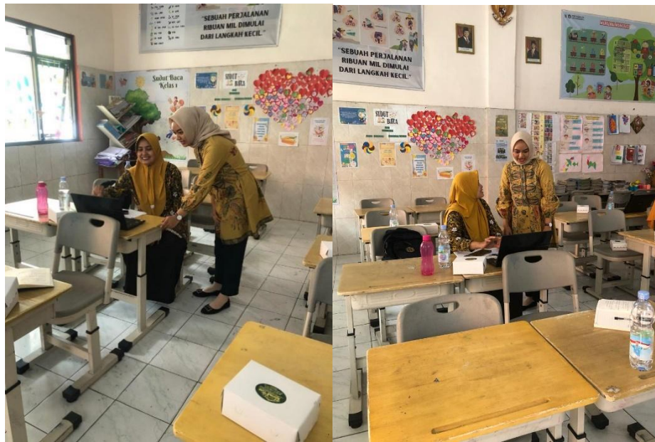
Gambar 6 Pendampingan Praktik Identifikasi PDPD

Praktik penggunaan tabel dilandaskan dengan pemberian beberapa video tentang PDPD di media sosial lalu pendidik mengidentifikasi dugaan hambatan pada video tersebut. Video yang ditayangkan tertera pada Gambar 7. Kegiatan pada hari kedua ini juga diakhiri dengan berfoto bersama seperti ditampilkan pada Gambar 8.