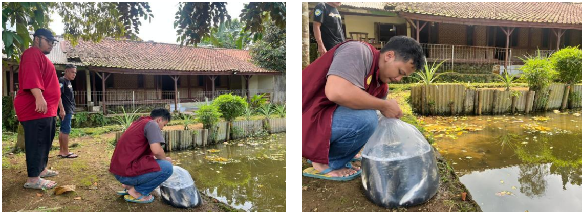
Gambar 3 Penebaran Ikan untuk Kegiatan Mancing Bersama (Dokumentasi PKM, 2026)

dan rekomendasi balong atau empang yang bisa dijadikan tempat kegiatan PKM, maka Kelompok Mahasiswa KPM tersebut melakukan survey dan meminta izin kepada pemilik balong untuk menjadikannya sebagai spot mancing dalam kegiatan PKM. Setelah mendapatkan persetujuan dan izin dari pemilik balong , maka persiapan selanjutnya ialah menebar ikan yang akan dijadikan tangkapan oleh masyarakat pada kegiatan mancing bersama tersebut. Ikan yang ditebar di balong tersebut adalah jenis ikan mas, nila dan mujair, dengan ukuran yang pas untuk dipancing. Berkenaan dengan tahap persiapan ini, gambaran umum pada saat Kelompok Mahasiswa KPM Desa Parakan Garokgek menebarkan ikan ke balong yang menjadi tempat kegiatan PKM dapat dilihat pada Gambar 3.