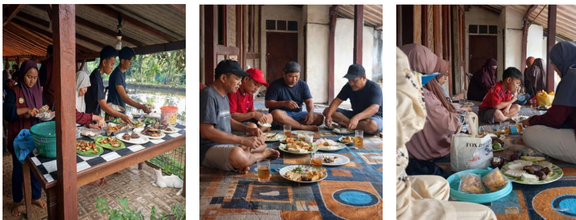
Gambar 5 Makan Bersama Setelah Kegiatan Mancing