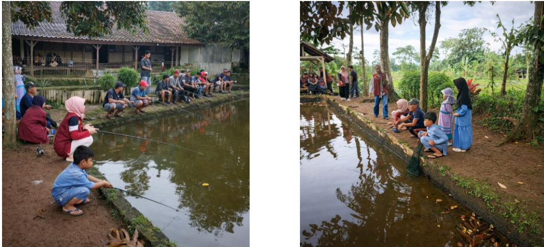
Gambar 4 Suasana Mancing Bersama di Desa Parakan Garokgek