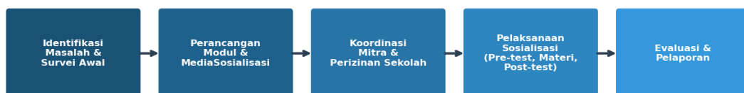
Gambar 1. Alur Pelaksanaan Kegiatan Pengabdian Masyarakat