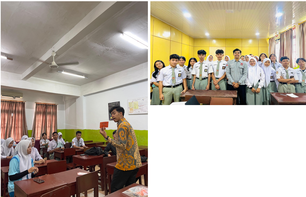
Gambar 2. Sesi sosialisasi anti rokok (kiri) dan foto bersama peserta (kanan)

Gambar 2 dan 3 mendokumentasikan aktivitas sosialisasi dan sesi foto bersama peserta.